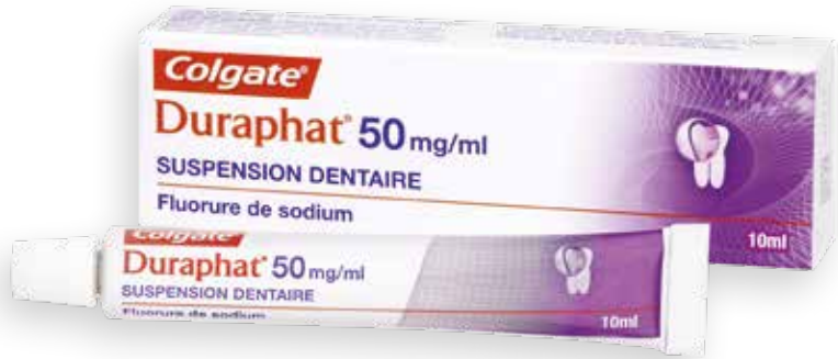
Duraphat® vernis* 1 tube de 10 ml (AMM)