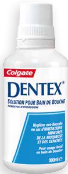
DENTEX® Solution pour bain de bouche 300 ml (AMM)

Tarif général et offres spéciales du 1 er mars 2026 au 28 février 2027